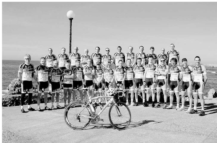
FOTO DI RITO. Il gruppone del Cral Continental